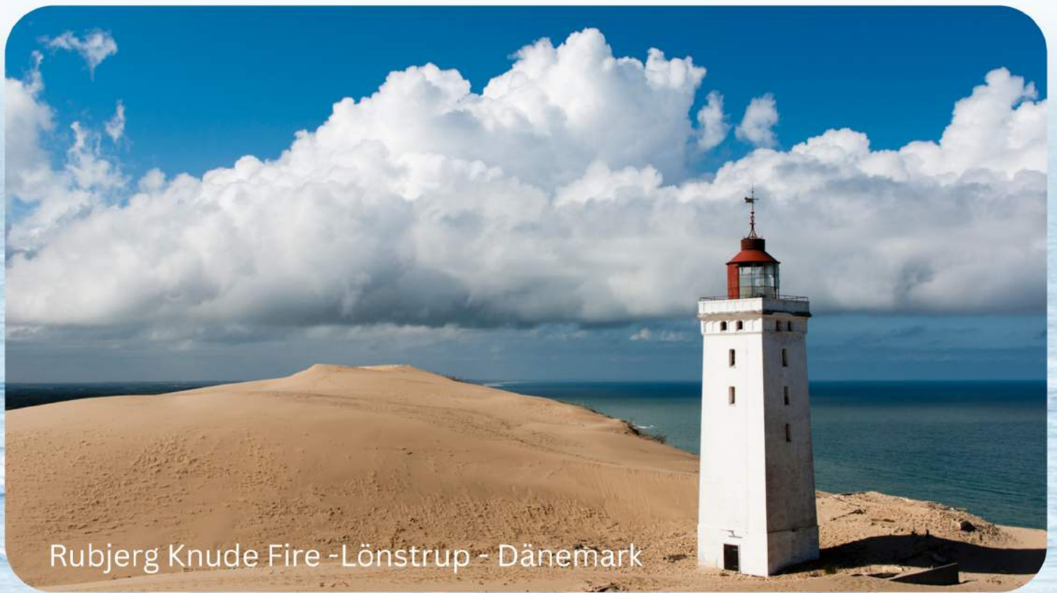
Rubjerg Knude Fire -Lönstrup - Dänemark

Sie möchten gerne vergangene Ausgaben des KredO Stadtgeflüster lesen oder sich neu für den Online-Newsletter anmelden?