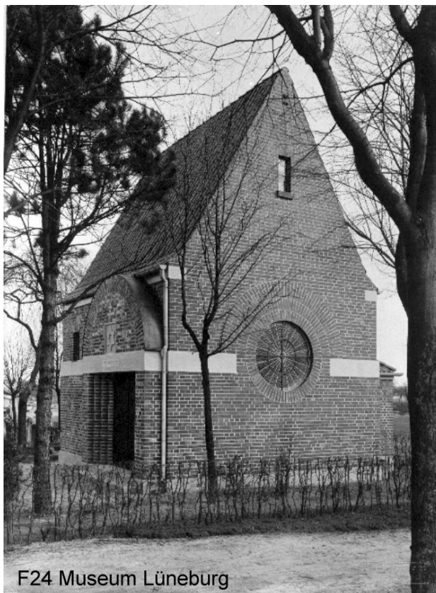
F24 Museum Lüneburg

Laßt uns scheiden von diesem treuen Gliede unseres Volkes im Gedenken an ihn mit dem Gelübde, mutiger und tapferer in der Gegenwart Gottes heiliges Wort als ein Wort der Liebe und Versöhnung zu bekennen, damit auch an unserem Leben das alte Prophetenwort gesegnet werde: ‚Ich habe dich einen kleinen Augenblick verlassen, aber mit großer Barmherzigkeit will Ich dich sammeln. [...] Denn es sollen wohl Berge weichen und Hügel hinfallen, aber Meine Gnade soll nicht von dir weichen und der Bund Meines Friedens soll nicht hinfallen, spricht der Herr, dein Erbarmender.‘ – Amen.“